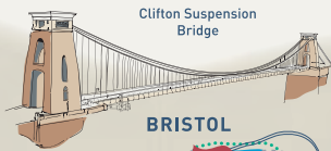
Clifton Suspension Bridge